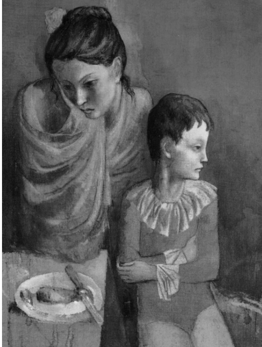
Resim 3: Baladinler, Picasso, 1905

Picasso, sirk çalışanlarını, kostümleri içerisinde betimlemesine karşın, onları gösterileri sırasında değil, sirk ortamından ve izleyicilerden uzak mekânlarda resmeder. Sahnedeki ışıltılı halleri yerine, sahne arkasındaki günlük yaşamlarına, dinlenme molalarında düşüncelere dalmış mutsuz anlarına odaklanır. Böylece eğlence dünyasının insanlarından bir melankoli sızmasını sağlar ancak bu hüznün; artık mavi dönemin bitmez tükenmez umutsuzluğundan kurtulur. Henüz sevinç ve toplumla kucaklaşma yoktur, ama yaşam vardır.